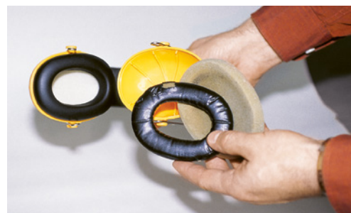
8 Les coquilles de protection doivent être soigneusement entretenues.

Une vidéo pour sensibiliser et motiver vos collaborateurs: «Napo – Le bruit ça suffit!» www.suva.ch/bruit > Outils > Films.